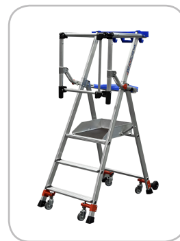
Modèle 3 marches