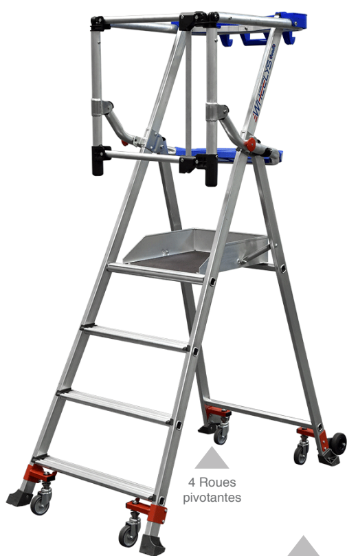
4 Roues pivotantes