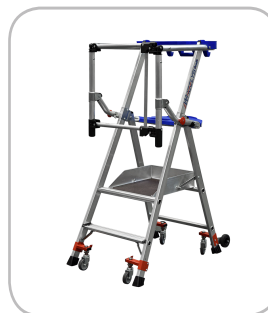
Modèle 2 marches

“ La PIRL nouvelle génération : 4 roulettes pivotantes qui changent tout ! ”