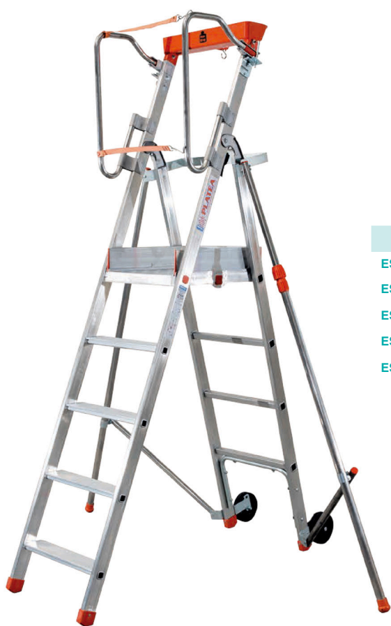
PLATE-FORME Individuelle pliante PIRL