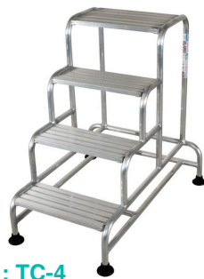
Réf : TC-4