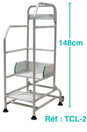
Réf : TCL-2