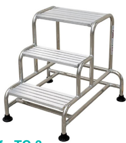
Réf : TC-3