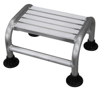
Réf : TC-1