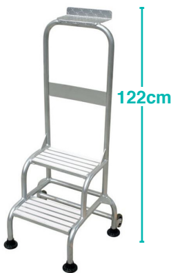
Réf : TC-2plus