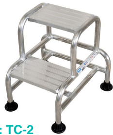
Réf : TC-2